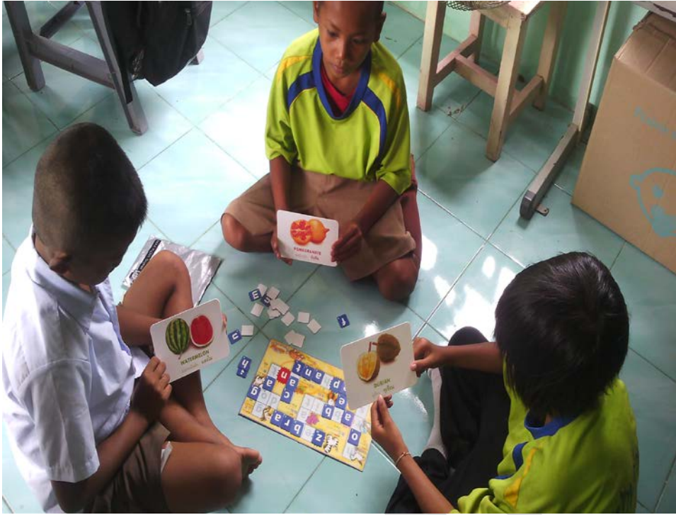
นักเรียนเรียนรู้คำศัพท์ภาษาอังกฤษด้วยรูปภาพ